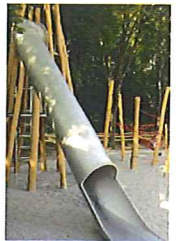
Toboggan - inox