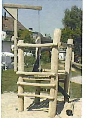
Mini chantier - robinier