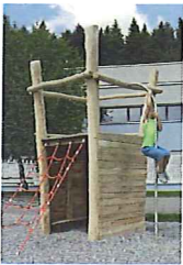
Affût perché sans toit - robinier