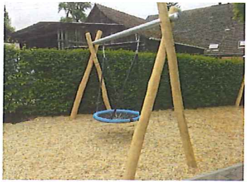
Balçoire nid d'oiseau combinée - robinier