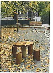
Table de jeu et tabouret en rondin - robinier