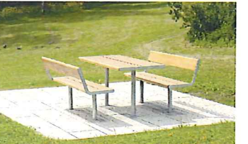
Table et bancs aprils de Vestre