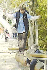
Ecole d'équilibre 2 - robinier