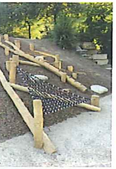
Poutre marches taillées et montée en rondins - robinier (sans file)