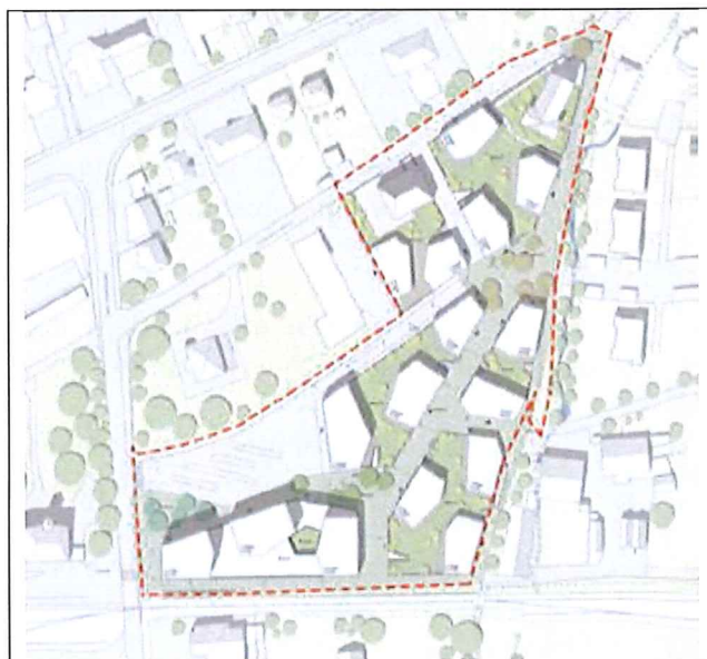
Fig. 1 : Projet retenu (source : Müller & Sigrist Architekten AG)

Copropriétaires de terrains stratégiquement localisés, la société Transports publics fribourgeois Immobilier (ci-après TPF IMMO) ainsi que la Commune d'Estavayer souhaitent aménager le secteur Gare-Casino d'une superficie d'environ 21'000 m 2 , situé à proximité de la gare d'Estavayer-le-Lac. TPF IMMO prévoit de valoriser ce site en créant un nouveau quartier de gare à la fois attractif et emblématique tout en exploitant les synergies entre les transports publics et le développement immobilier (la future gare routière régionale étant à l'avenir implantée au cœur du quartier).